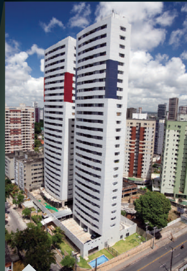
ED. SAN TIAGO E SAN TELMO Casa Amarela