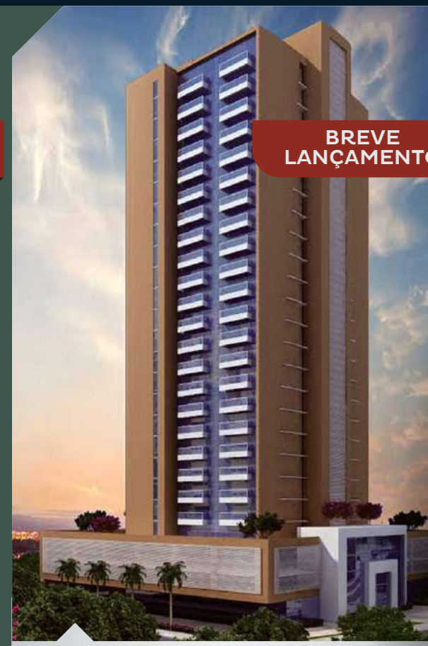
ED. VILLA PASSAREDO Guararapes