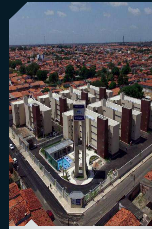
RES. NOVO ANIL Cohab/Anil