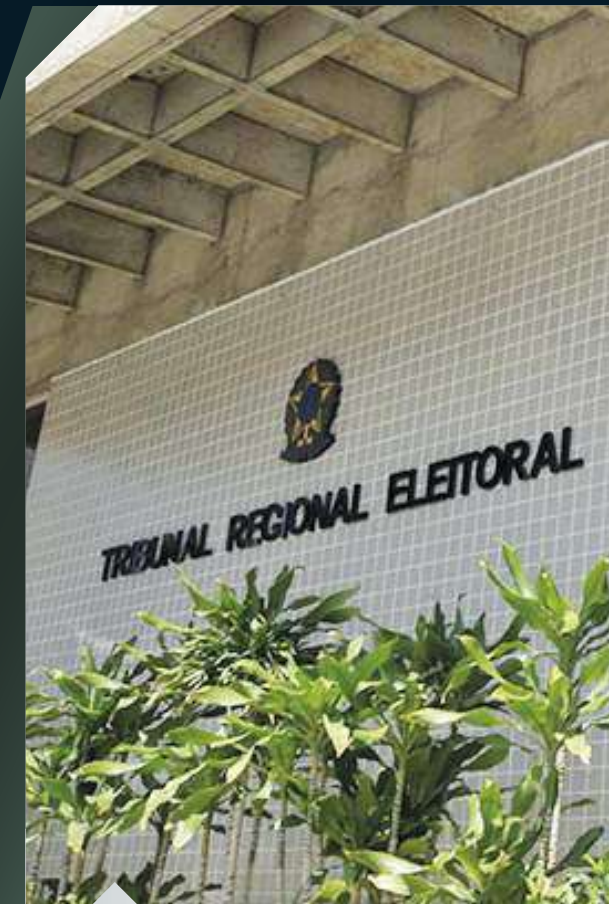
TRIBUNAL REGIONAL ELEITORAL