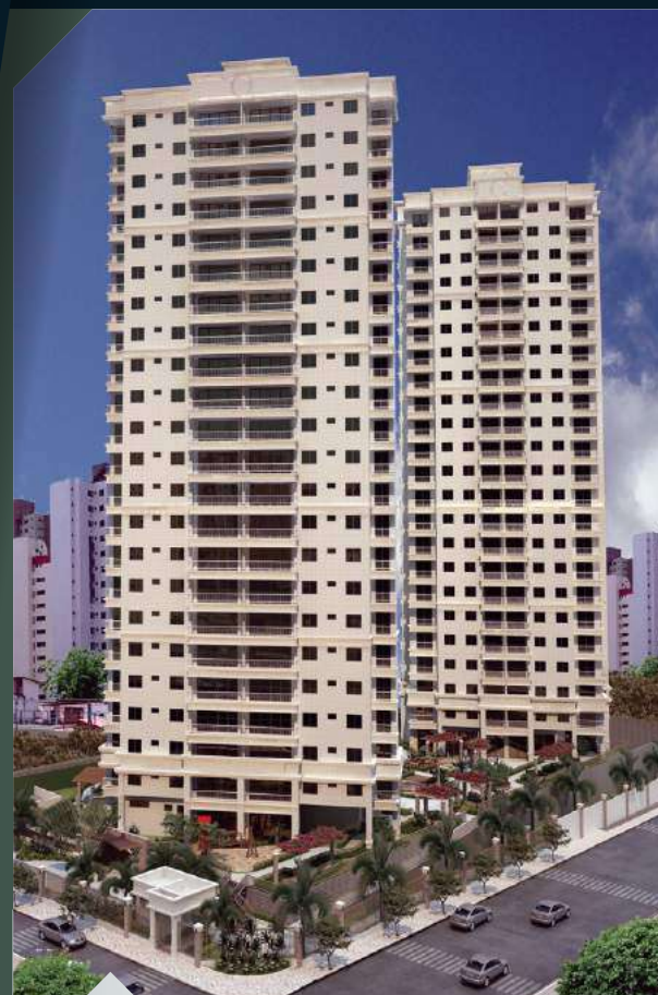
CONDOMÍNIO BELAS ARTES Joaquim Távora