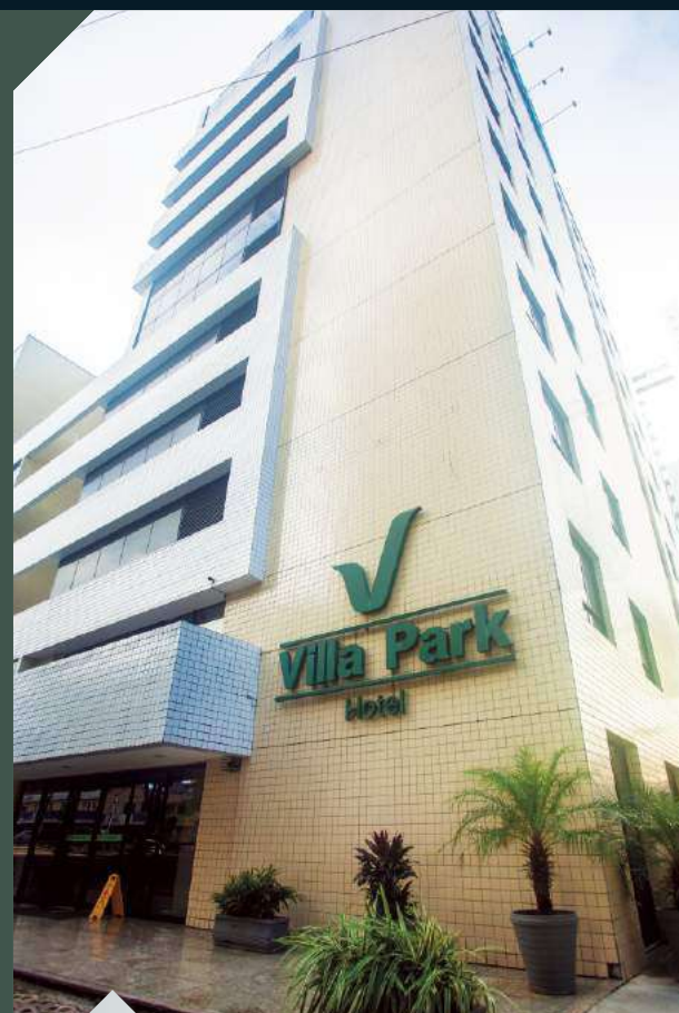
VILLA PARK HOTEL NATAL