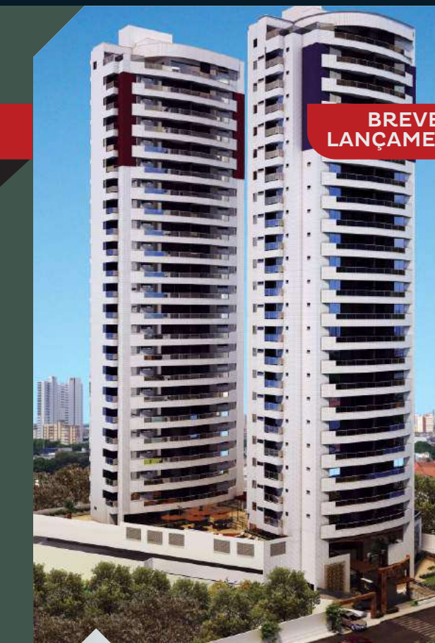
RESERVA VILMARY Jockey