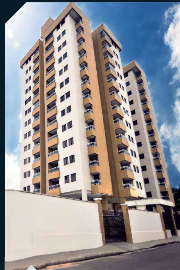
COND. ÎLE de FRANCE Turú