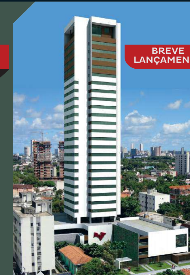
ED. TORREÃO EXECUTIVE PLAZA Encruzilhada