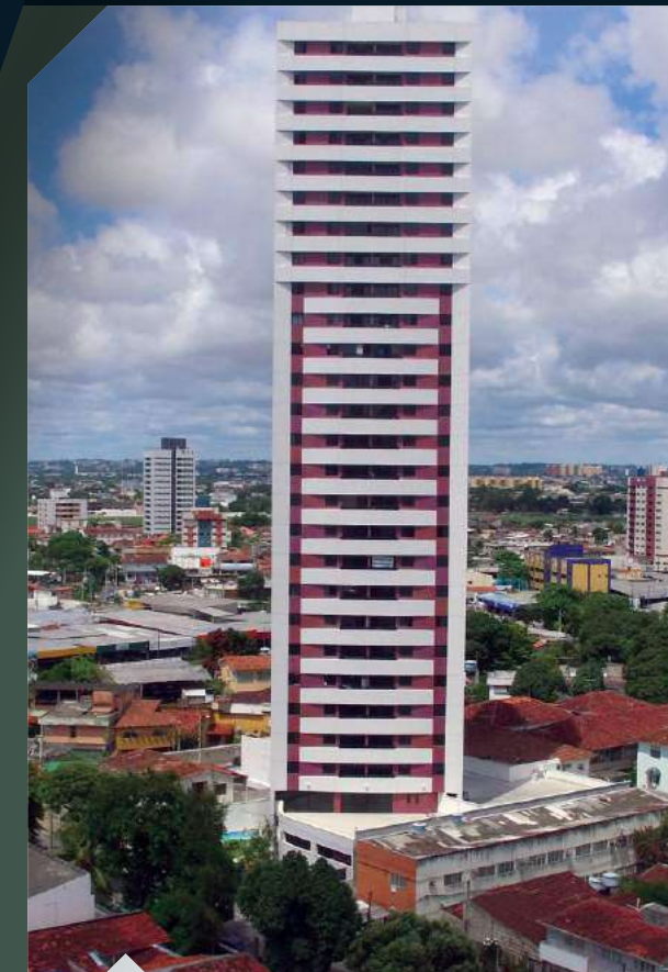
ED. VILLA SANTORINI Madalena