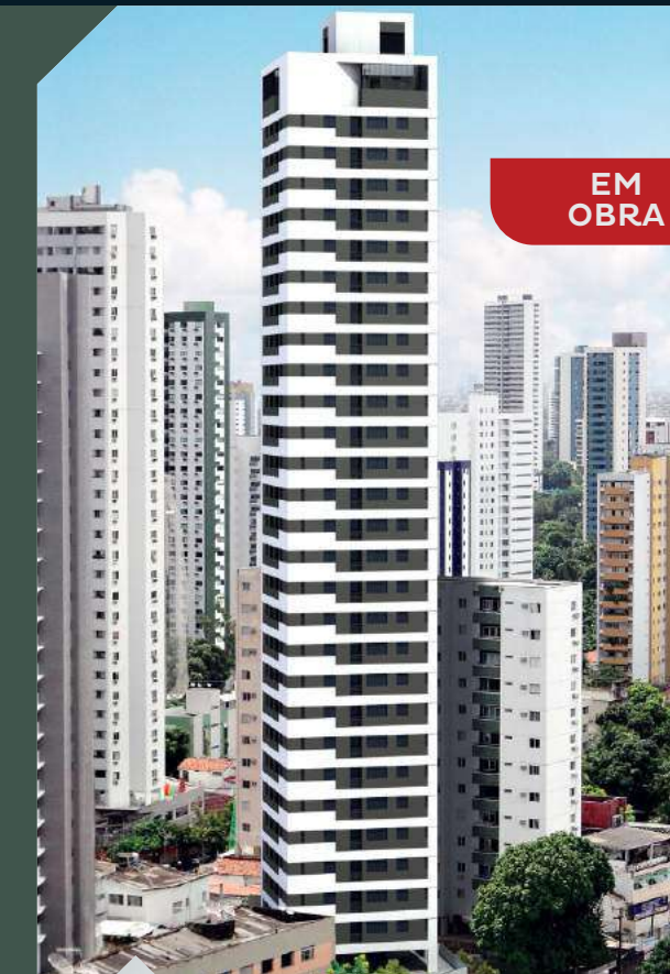
ED. DIPLOMATA PREMIUM Casa Amarela