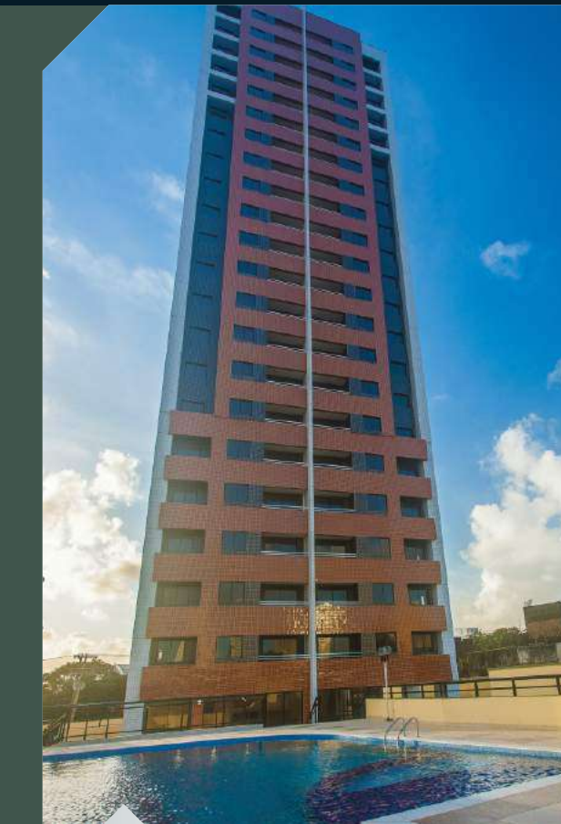
ED. ALTO DA BOA VISTA Cidade Alta