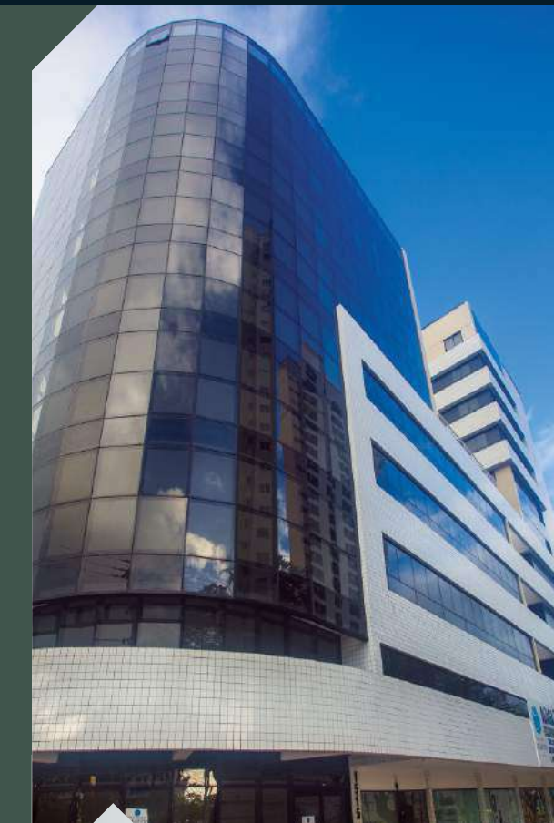
EXECUTIVE PARK Anexo ao HOTEL VILLA PARK Tirol