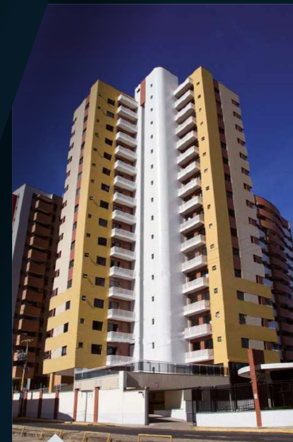
ED . MAISON RENOIR Ponta do Farol