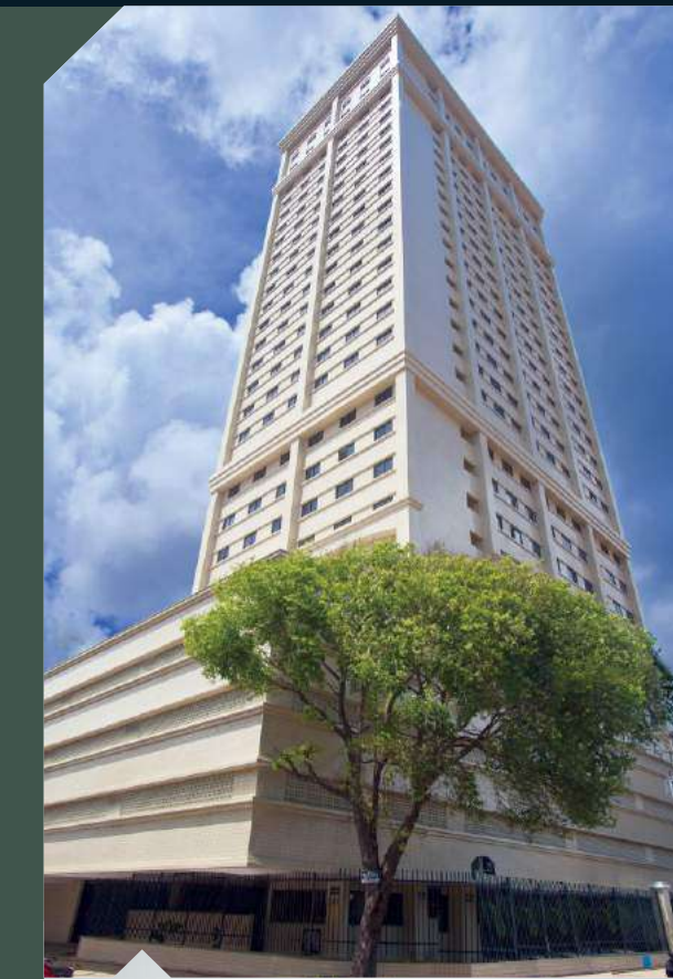
ED. SKY TOWER Centro