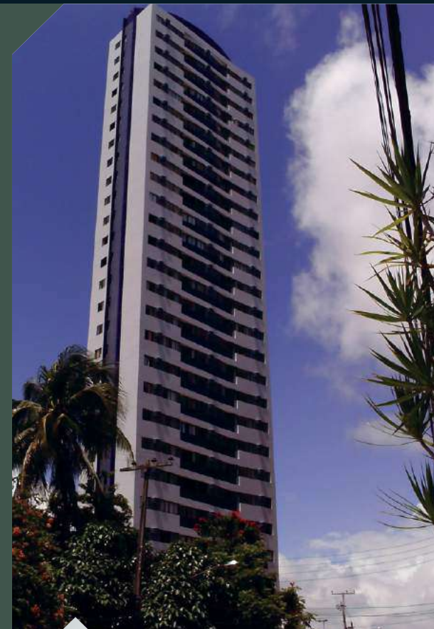
ED. LA VIVANCE Boa Viagem