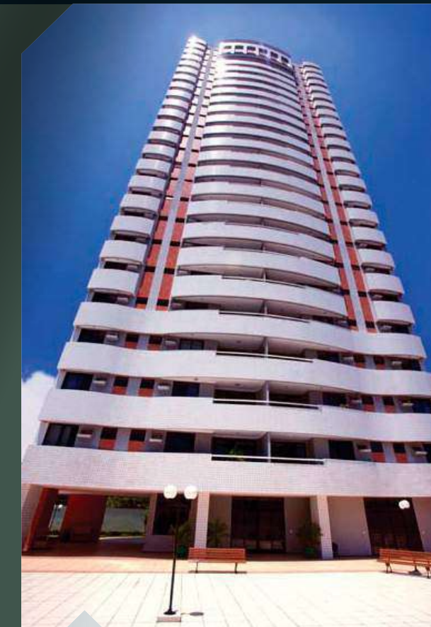
ED. GRAND VERNISSAGE Praia de Iracema

São mais de 22 empreendimentos concluídos. Conheça alguns deles.