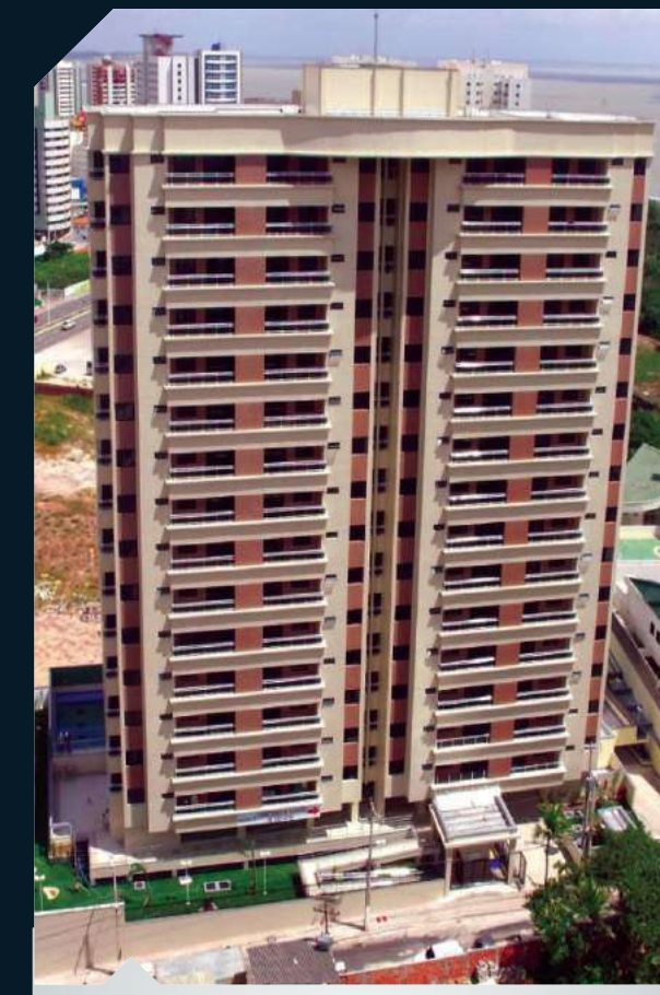
ED . DELLAMARE Ponta do Farol