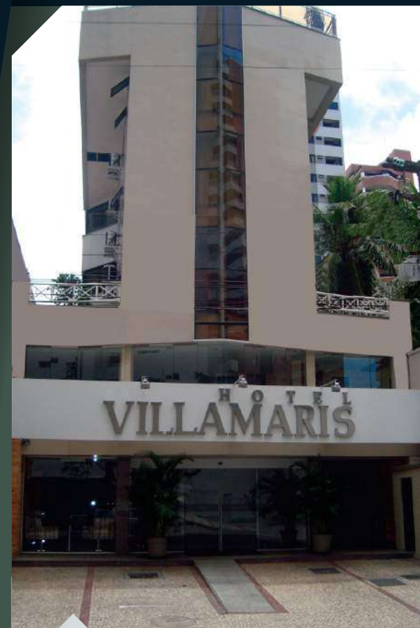
HOTEL VILLAMARIS FORTALEZA

Em seu projeto de expansão no ramo da Hotelaria, o GRUPO MONTEPLAN agora investe em um novo empreendimento em Recife-PE, aumentando e consolidando o foco no setor de turismo e negócios.