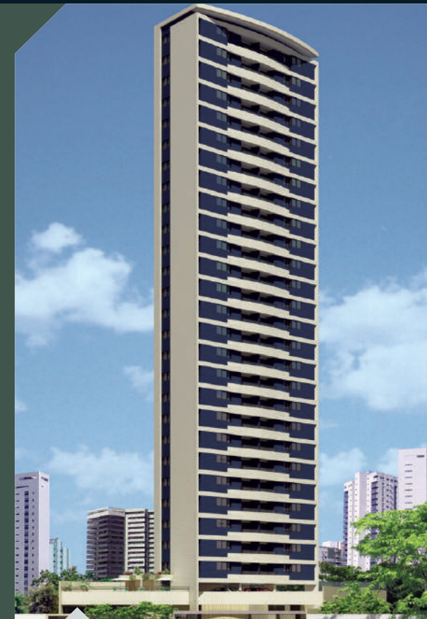
ED. VILLA CARMEL Casa Amarela