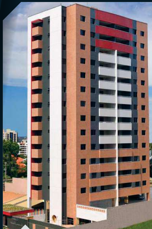
ED . MAISON MONET Ponta do Farol