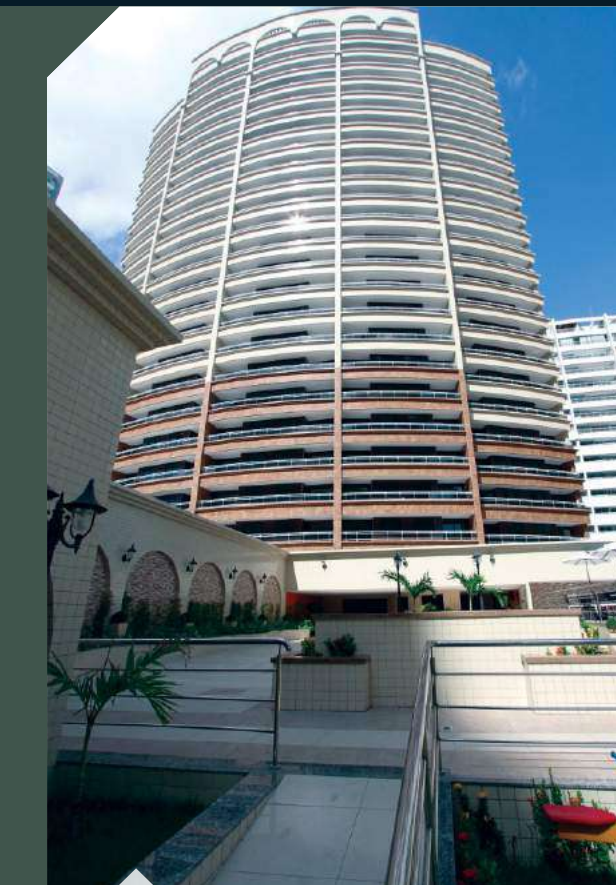
ED. PIAZZA COLISEU Praia de Iracema