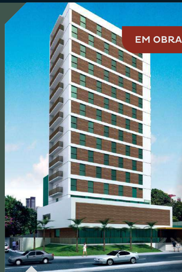
HOTEL VILLA D'ORO RECIFE