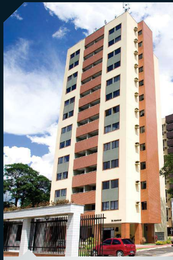
COND. VILLE DE FRANCE Turú